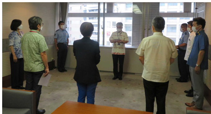
阿波連委員長挨拶