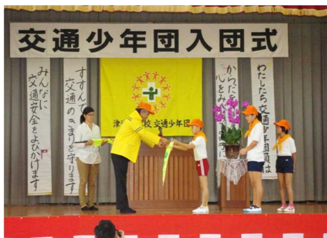
【交通少年団の結成・入団式】