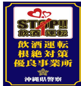
【飲酒運転根絶対策優良事業所認定】