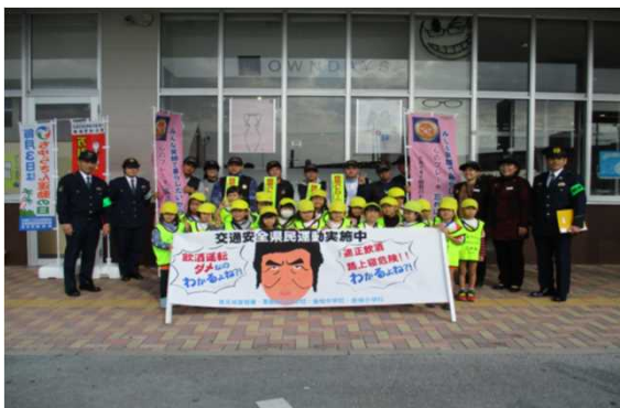
【交通ボランティアと連携した広報啓発活動】