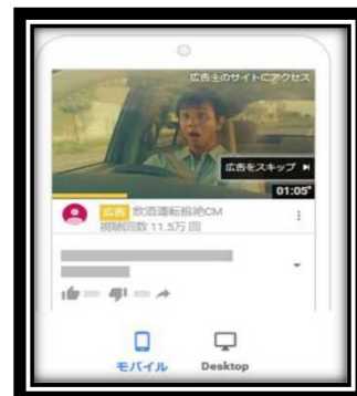
【ユーチューブでのスキップ広告】