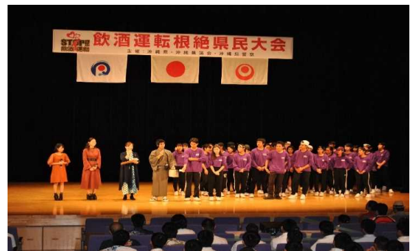
【飲酒運転根絶県民大会】