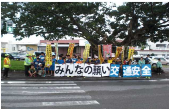
【毎月1日 飲酒運転の根絶運動の日】