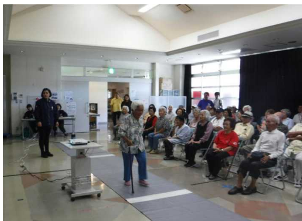
【歩行者シミュレーターを活用した交通安全教育】