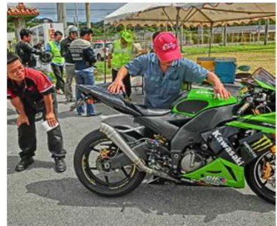
【白バイ隊員による二輪車実技指導】【高校生に対する二輪車実技指導】【二輪車販売店と連携した街頭点検】

また、県内では、主要な幹線道路の国道58号、国道330号、国道329号などの総延長82kmの区間において、二輪車の通行を 第1通行帯に指定 する交通規制を実施しています。