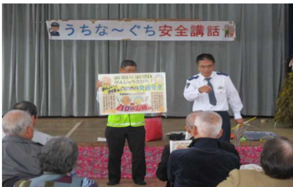
【飲酒運転根絶講話の実施】