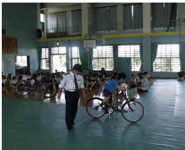
【子供自転車交通安全教室】

等を実施して子供の事故防止対策の他、小学校を母体とする交通少年団の結成の促進及び活動の支援を行なっています。