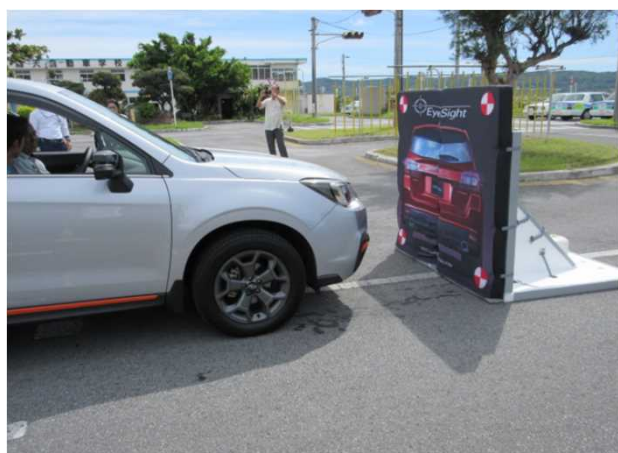
【安全運転サポート車体験による交通安全教育】