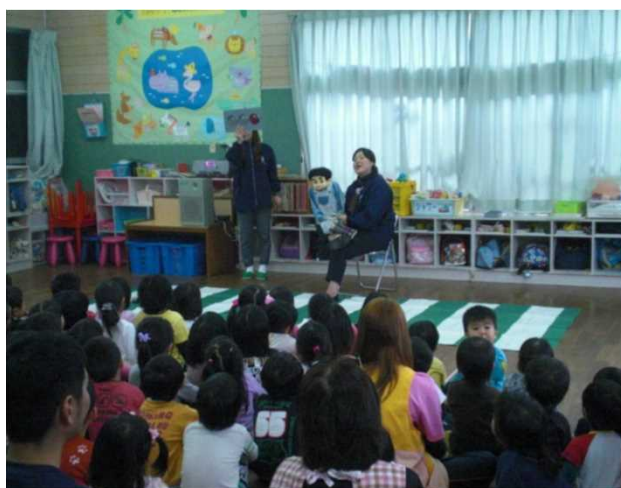
【腹話術による交通安全教室】