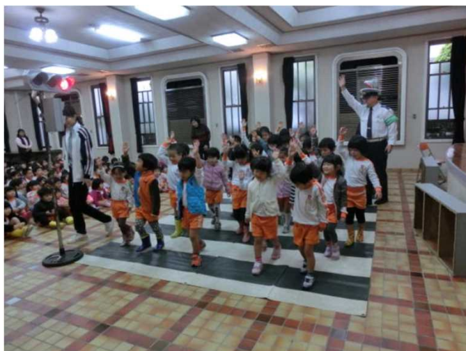
【新入園児、児童へ横断歩道の渡り方指導】