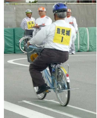
【高齢者自転車大会】