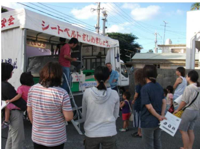
【シートベルトコンビンサーを活用した体験型交通安全教室】