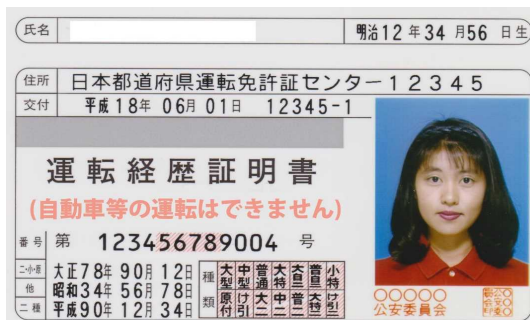
運転経歴証明書(見本)

※但し、運転免許証の返納(申請取消)をしないで、免許を失効した場合は運転経歴証明書は発行されません。