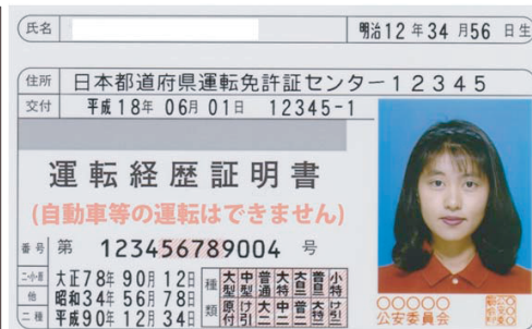
運転経歴証明書(見本)

※但し、運転免許証の返納（申請取消）をしないで、免許を失効した場合は運転経歴証明書は発行されません。