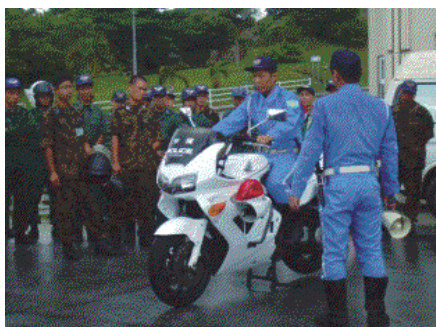
白バイ隊員による二輪車実技指導