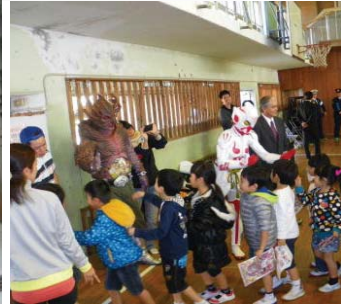
ちゅらさんコンサート 登下校時における安全指導 ハルサーエイカーによる防犯講話