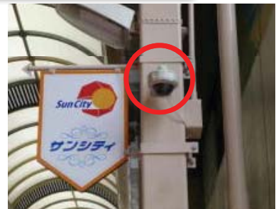
防犯ボランティアによる環境浄化作戦 自治体と連携した公園防犯パトロール 商業環境整備事業に伴う防犯カメラの設置