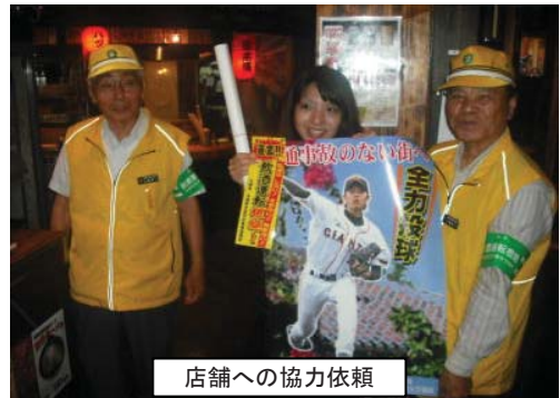
店舗への協力依頼