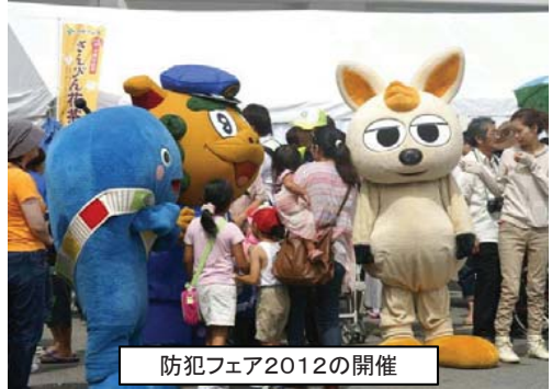
防犯フェア2012の開催