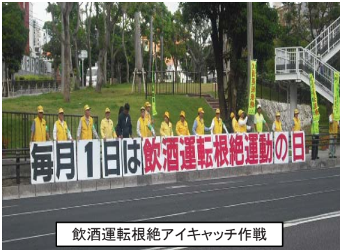
飲酒運転根絶アイキャッチ作戦