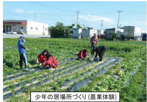
少年の居場所づくり(農業体験)