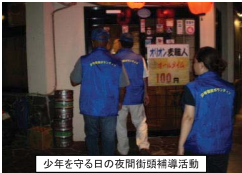
少年を守る日の夜間街頭補導活動