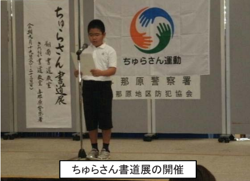
ちゅらさん書道展の開催