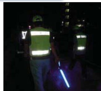
安全安心アカデミー講座の開催 青色回転灯装備車両の出発式 夜間合同パトロール