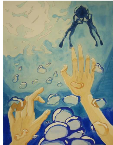
浦添工業高校3年 伊波 瑞季